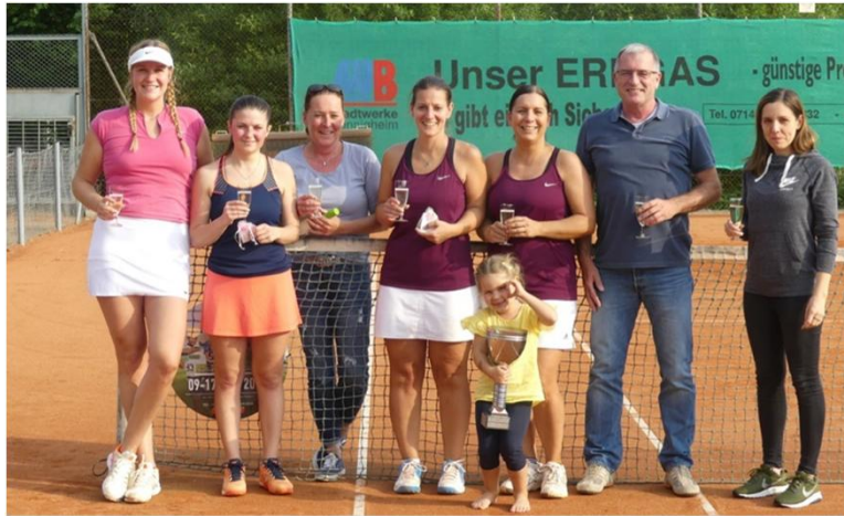
Clubmeister im Doppel 2018